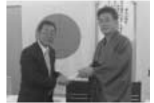
【結婚】織田ご夫妻 29日