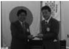
【結婚】太田原ご夫妻 25日