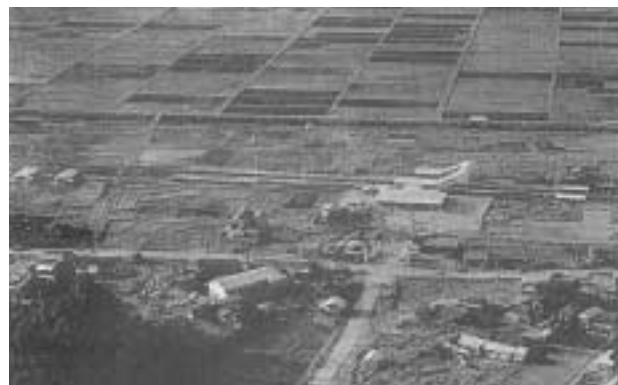
昭和33年12月25日・北松戸駅が常設駅に