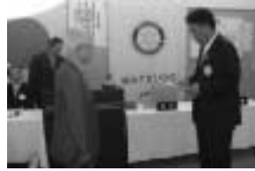
常盤会長と土屋亮平会員