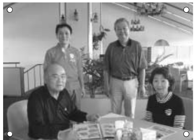
クラブハウスにて