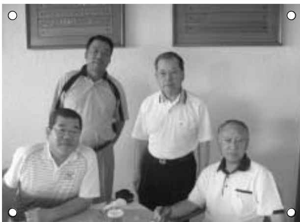
クラブハウスにて