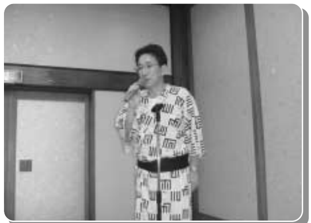
常盤会長エレクト 挨拶