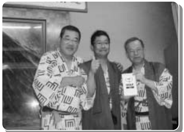
親睦ゴルフ成績発表