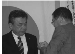
伊原会長と 新入会員 飛田会員