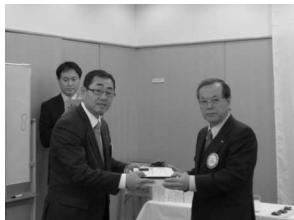
ポールハリスフェロー 織田会員