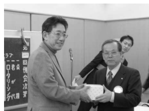
結婚記念祝 常盤会員