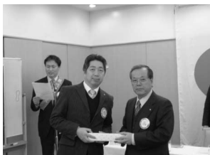
入会記念祝 下田会員