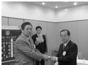
ポールハリスフェロー 大川会員