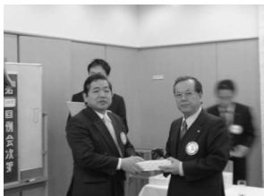
入会記念祝 小倉会員